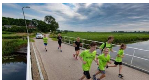
Deze kinderen uit Heerde rennen 27 kilometer naar Kampen om geld in te zamelen tegen kinderanker